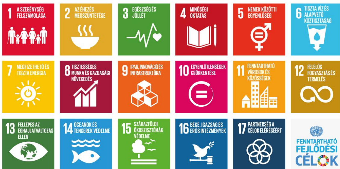
Fenntartható fejlődési célok

Királyszentistván célrendszere a 2015 őszi elfogadott Fenntartható Fejlődési Keretrendszer 1 és annak gerincét képező célrendszer végrehajtását, azaz a világ fejlődési pályájának fenntartható irányba állítását támogatja. A keretrendszer alapjait a kiegyensúlyozott társadalmi fejlődés, a tartós gazdasági növekedés és a környezetvédelem képezik. 2